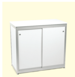
Infotheke € 150,40 Bari Info counter 103 x 53 x 94 cm weiß/white (0021)