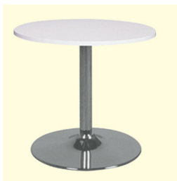
Tisch/Table € 50,60 Amato Ø 70 cm, Platte weiß, schwarz oder buche/Table top white, black or beech (0294)