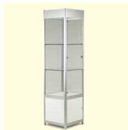
Standvitrine € 250,60 Griante 50 standing showcase 51 x 51 x 200 cm weiß/white (0052)