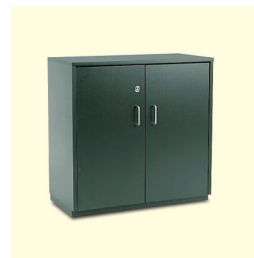
Sideboard € 97,20 Bellano weiß/schwarz/grau/ Sideboard white/black/grey (0048)