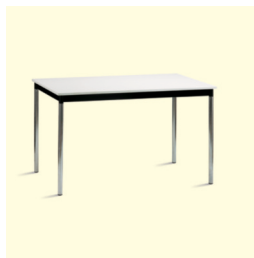
Tisch/Table € 53,20 Merida 120 x 70 cm, weiß/ schwarz/white/black (0024)