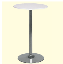
Stehtisch/Table € 58,30 Amato Ø 60 cm, Platte weiß, schwarz oder buche/Table top white, black or beech (0295)