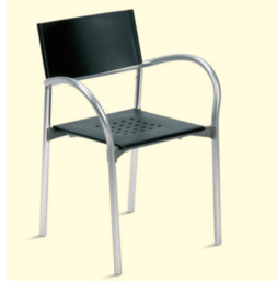
Stuhl/Chair Breeze (0029) € 30,20