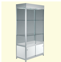
Standvitrine € 316,10 Griante 100 standing showcase 100 x 51 x 200 cm weiß/white (0014)