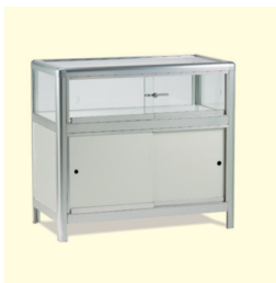
Tischvitrine € 190,30 Etna Table showcase 99 x 53 x 91 cm weiß/white (0015)