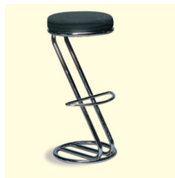
Barhocker € 27,60 Patti Bar stool schwarz/black (0022)