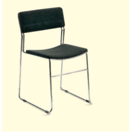
Stuhl/Chair Asti (0028) € 24,00