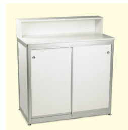
Infotheke € 174,90 Bari mit Aufsatz Info counter with build up 103 x 53 x 114 cm weiß/white (0053)