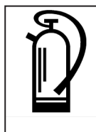
Kohlendioxid CO 2 Typ II